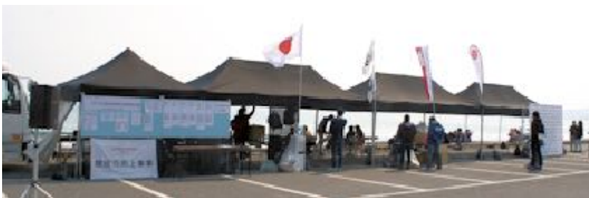
↑ 実戦トレーニングは鴨川マルキポイント会場の本部 ↓