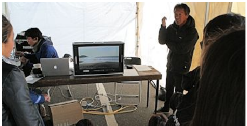
実戦トレーニング後にはビデオでチェック

KAWAI SURF GALLERY & SURF BOARDS ◆千葉県鴨川市横浪 135-1 TEL : 0470 (93) 1173 月曜日休み