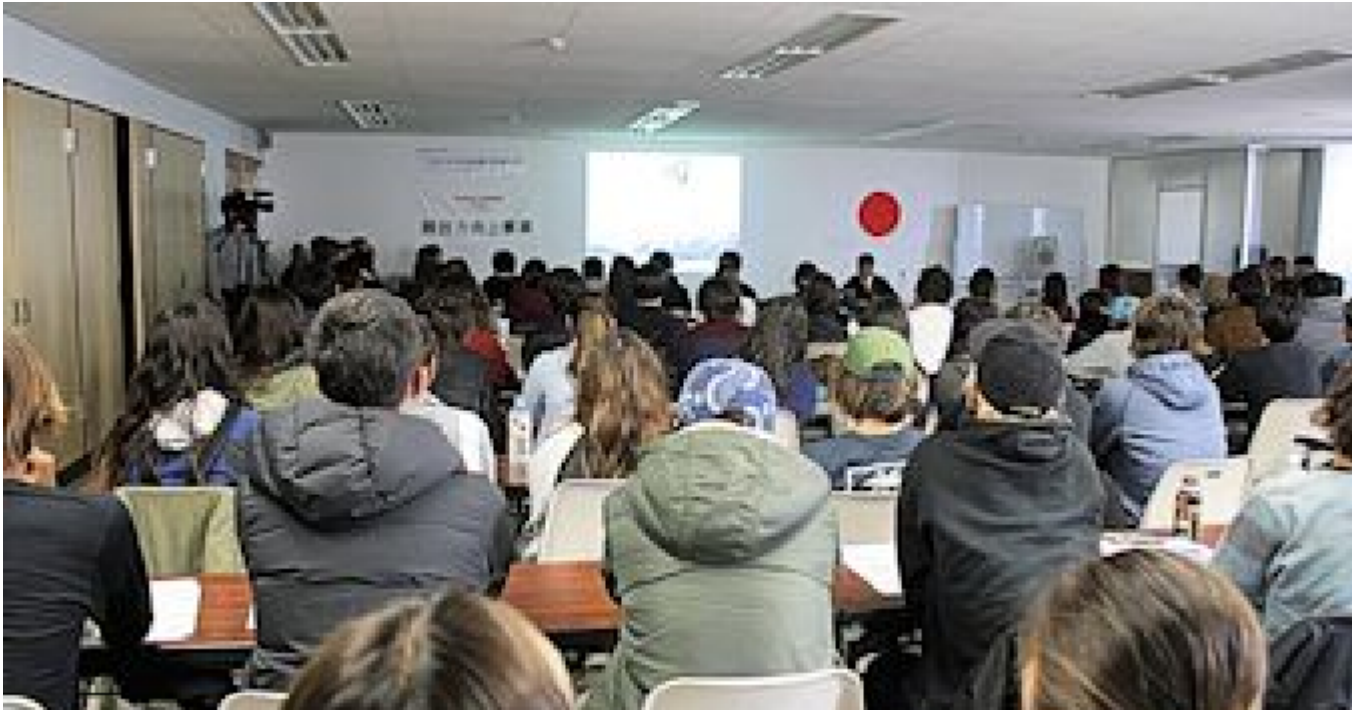
関係者の講習に必死になって耳を傾ける