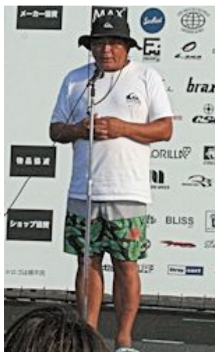
大会関係者の挨拶