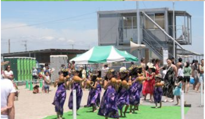
地元の小中学生によるフラダンスを披露！