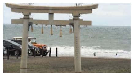
一番の人気ポイントに「釣ヶ崎海岸」

から腹ぐらいの波が打ち寄 せ、選んで巧みに乗ってい て、それほどのトラブルも 見られなかった。